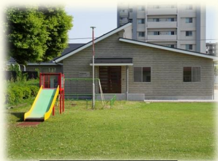
学校の正門からの入口