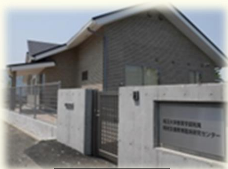
道路側の出入り口